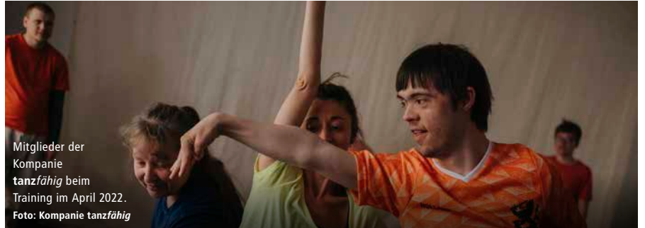
Mitglieder der Kompanie tanzfähig beim Training im April 2022.

Ein Tanzangebot an einer Oberschule mit dem Förderschwerpunkt „Geistige Entwicklung“, das seit einigen Jahren von TanzZeit e.V. mit großem Erfolg durchgeführt wird, endet mit dem Schulabschluss. Für die Beteiligten gibt es keine weiterfüh-