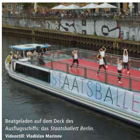
Beatgeladen auf dem Deck des Ausflugsschiffs: das Staatsballett Berlin.

Einen getanzten Gruß in die Stadt schickt das Staatsballett Berlin Ende August mit der mobilen Gala „FROM BERLIN WITH LOVE – auf der Spree“. Auf dem Deck eines Ausflugsschiffs werden dann ausgewählte Auszüge aus dem Klassiker „Schwanensee“ und dem beatgeladenen, zeitgenössischen Tanzstück „Half Life“ der israelischen Choreografin Sharon Eyal gezeigt. Ergänzt wird der sich zyklisch zwischen dem Haus der Kulturen der Welt und der Mühlendamm Schleuse wiederholende Programm-Mix mit Arbeiten junger Choreograf*innen aus dem Staatsballett-Ensemble. Die kostenlose und wie auf die Hauptstadt zugeschnittene Loveparade der anderen Art fand pandemiebedingt das erste Mal im Sommer 2021 statt. Dieses Jahr nun dürfen alle Interessierten das Mehr an Bewegungsfreiheit doppelt genießen. (cm)