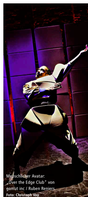
Menschlicher Avatar: „Over the Edge Club“ von gamut inc / Ruben Reniers.

Where do we come from? Who are we? Where are we going? In „Over the Edge Club“ at the Theater im Delphi, these questions are situated in a techno-futuristic setting. And what happens