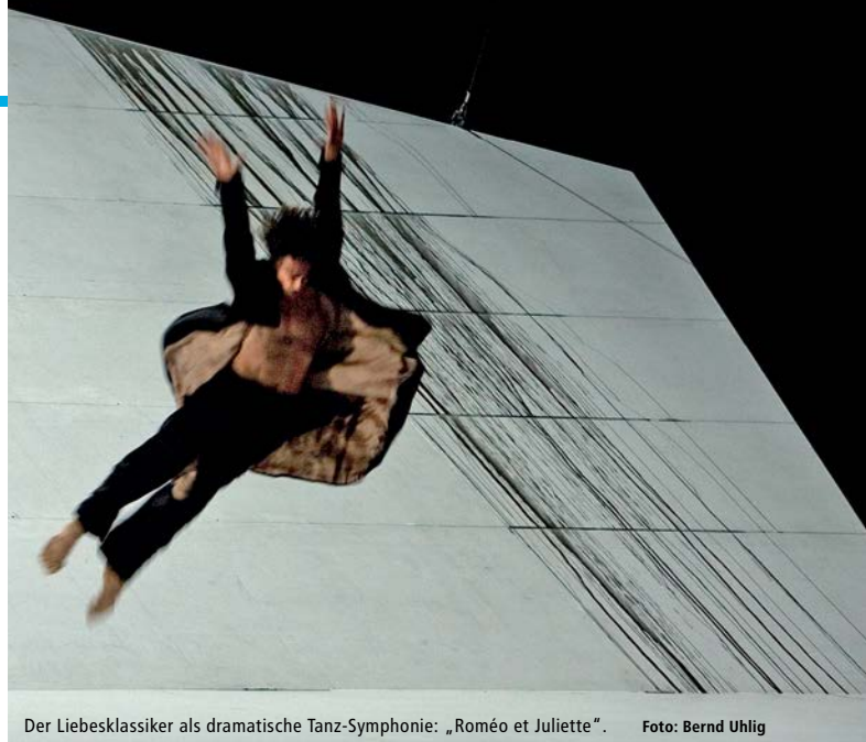
Der Liebesklassiker als dramatische Tanz-Symphonie: „Roméo et Juliette“.

It's a rather strange story: In 2005, after Sasha Waltz and her dance company had created their first globally successful opera-dance-theatre "Dido and Aeneas," the Paris Opera invited her to direct the dramatic symphony "Roméo et Juliette" by Hector Belioz for the in-house corps de ballet, three dance soloists, three opera singers and two choirs in 2007. Sasha Waltz had only once previously choreographed outside of her own company and rehearsed with her ensemble in Berlin before transferring the near final choreography to the Parisian ballet. A restaging was opened in