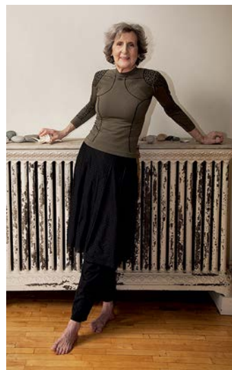
Stellt 2015 die Aufführung ihrer Bühnenwerke ein: Trisha Brown, hier 2010.

A progressing memory game helping foster a simultaneously simple yet complex body sculpture in the surrounding space. So it was when dance met art at the 2013 Tanz im August when the Trisha Brown Dance Company performed Brown's postmodern classic solo piece „Accumulation“ (1971) as a duet at the