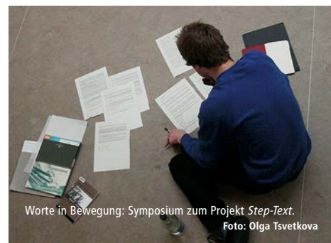
Worte in Bewegung: Symposium zum Projekt Step-Text .