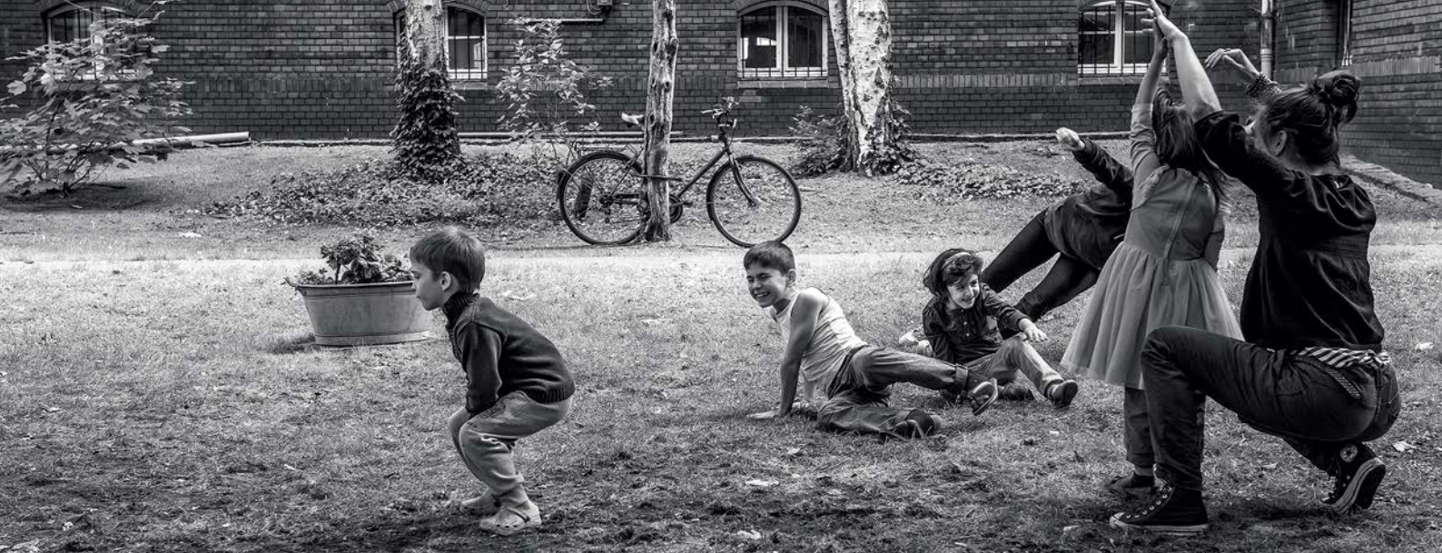
Für einen Moment spielerisch ankommen? Das möchte die Berlin Mondiale den Geflüchteten ermöglichen.