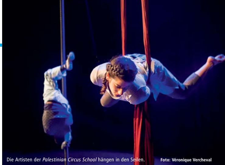
Die Artisten der Palestinian Circus School hängen in den Seilen.

“In the new circus”, the announcement promises, “the avant garde of the arenas has broken ranks with the older, traditional man-animal spectacles of the past”. The genre of multi-talented circus personalities has long since been established, and fabrik Potsdam is providing fresh material for audiences with its own series “Neuer Circus”. The Berlin based Circus Sonnenstich is exemplary of a brand of happy-go-lucky/poetic circus that amazes, provides great