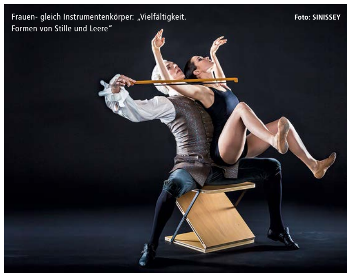
Frauen- gleich Instrumentenkörper: „Vielfältigkeit. Formen von Stille und Leere“